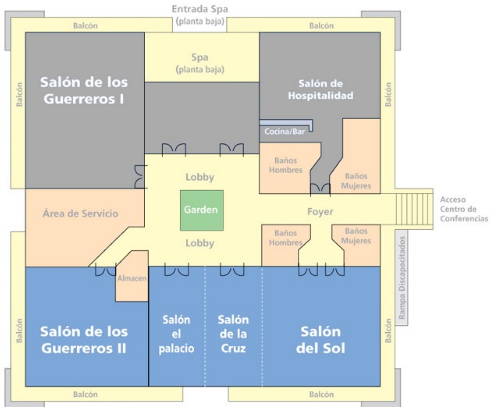
Plano Centro de Conferencias